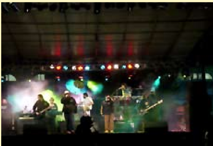
Ultramen empolga os estudantes do IPA

da com muita música. Logo no início o Coral Centro Ecumênico de Cultura Negra (Cecune) fez uma apresentação na sacada frontal do prédio. O espetáculo foi marcado por sons e luzes especiais.