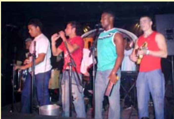
Banda Di Qualidade toca às sextas-feiras

A celebração de inauguração foi festeja-