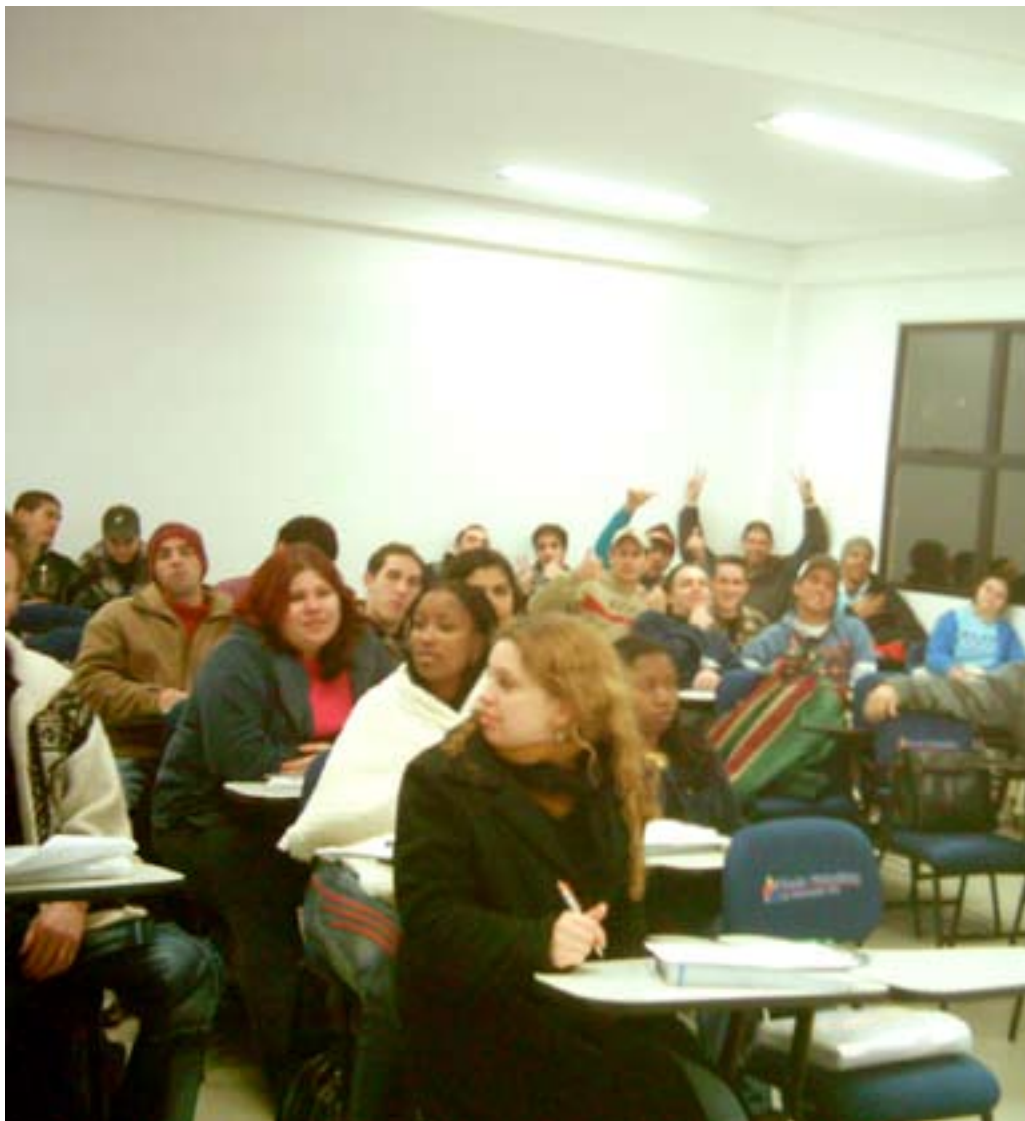
Estudantes do 1º Semestre de Publicidade aliam a teoria e a prática