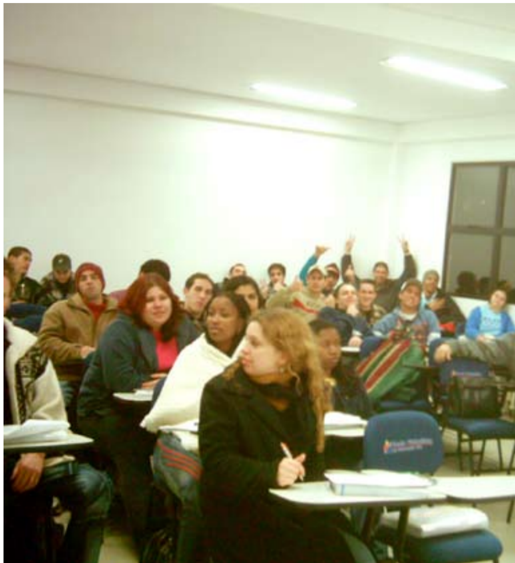
Estudantes do 1º Semestre de Publicidade aliam a teoria e a prática