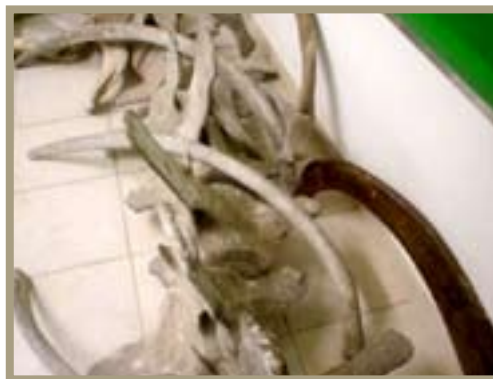
Ossada de baleia

Isabel Gravato conta com a colaboração de alunos, funcionários e interessados em geral para reestruturar e ampliar o acervo. "Todas as doações para o Museu de Ciências do IPA serão bem-vindas para o crescimento e o enriquecimento da Instituição".