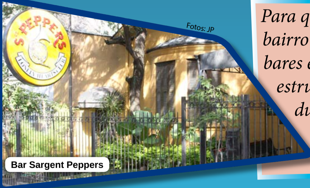
Bar Sargent Peppers

Para quem procura lazer e descontração, o bairro Rio Branco oferece várias opções. Os bares e as casas noturnas possuem uma boa estrutura para receber seus clientes, tanto durante o dia para fazer um “happy hour” com os amigos ou à noite para quem curte uma balada.