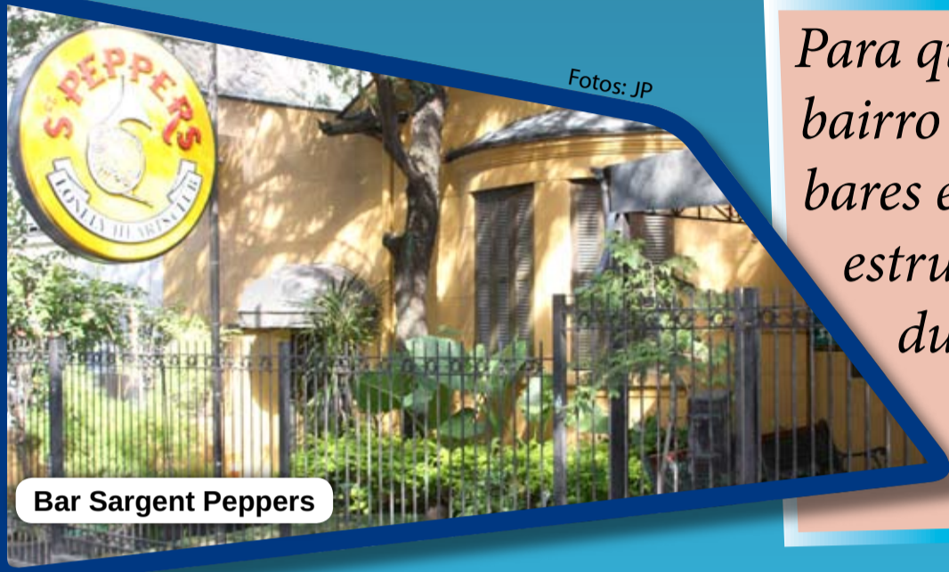
Bar Sargent Peppers

Para quem procura lazer e descontração, o bairro Rio Branco oferece várias opções. Os bares e as casas noturnas possuem uma boa estrutura para receber seus clientes, tanto durante o dia para fazer um “happy hour” com os amigos ou à noite para quem curte uma balada.